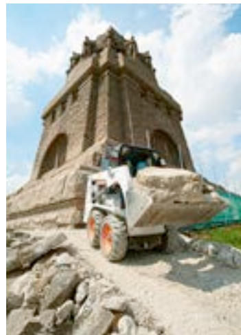
Der Kompaktlader aus dem HKL MIETPARK erledigt Transport und Verladung am Völkerschlachtdenkmal effizient.