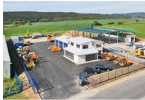
Das HKL Center in Jena-Laasdorf stellt die modernen Maschinen für das Bauprojekt.