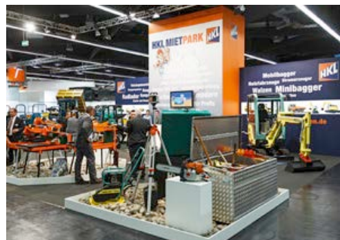
HKL präsentiert auf der GaLaBau 2014 sein umfangreiches Angebot für den Garten- und Landschaftsbau.