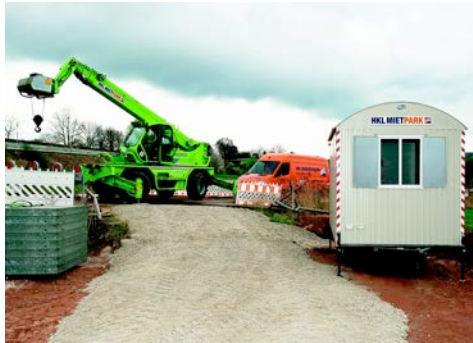
Teleskopmaschinen aus dem HKL MIETPARK unterstützen Gleisbauprojekt in Thüringen.