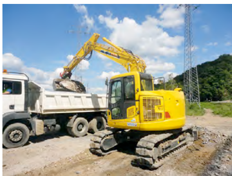
Raupenbagger aus dem HKL MIETPARK erledigen effizient den Erdhaushub für den Pfeilereinbau westlich der Lennetalbrücke.