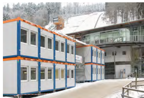
Raumsysteme aus dem HKL MIETPARK begleiten den FIS Skisprung Weltcup in Willingen.