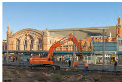
Ein 24-Tonnen-Raupenbagger von HKL bei der Tiefensondierung auf dem Bremer Bahnhofsvorplatz.