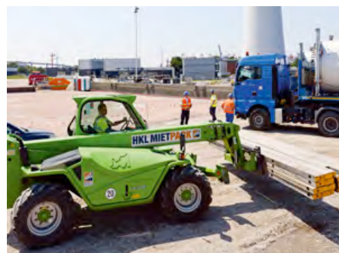
Eine leistungsstarke Teleskopmaschine aus dem HKL MIETPARK unterstützt den Aufbau der Windkraftanlage auf dem Klärwerksgelände Köhlbrandhöft im Hamburger Hafen.