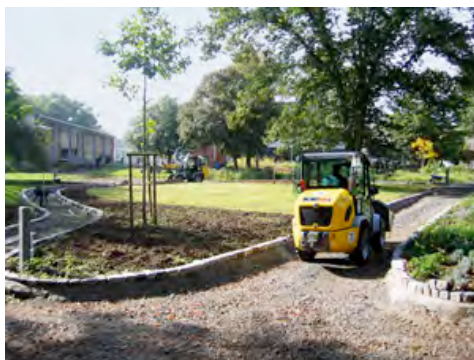
Ein allradbetriebene Radlader von HKL hilft beim Einbau der vielen Tonnen Schotter in die Zuwegung des Parks.