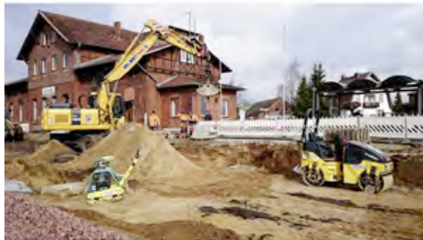
Mobilbagger, Kettenbagger, Walzen, Vibrationsplatten und Lichtaggregate aus dem HKL MIETPARK kommen beim Bahnhofsumbau in Crivitz zum Einsatz.