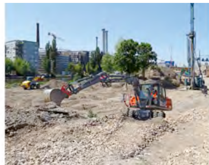
Zahlreiche Maschinen aus dem HKL MIETPARK sind bei dem visionären Bauprojekt am Berliner Holzmarkt im Einsatz.