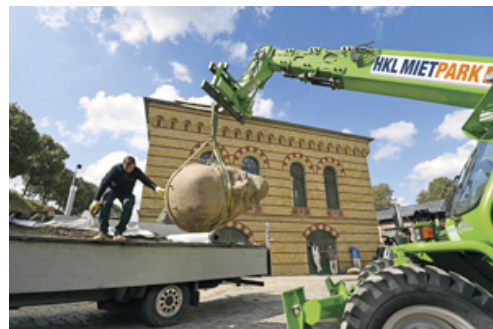
Entladung und Aufstellung des Lenin-Kopfes in der Zitadelle Spandau übernahm eine Teleskopmaschine von HKL.