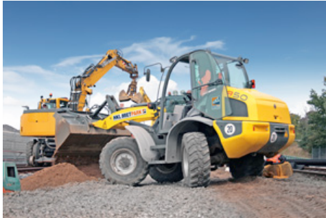
Ein allradgelenkter Radlader von HKL übernahm Transport und Umladung von Erdmassen und Schotter.