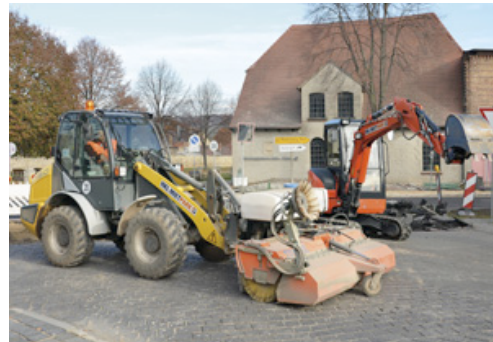
Einsatz an der B176: Ein mit Anbauehrmaschine ausgestatteter Radlader von HKL sorgt für Sauberkeit auf dem Bauabschnitt.