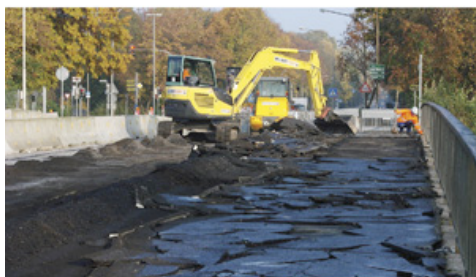
Voller Einsatz über der Trave: Minibagger und Radlader von HKL sind auf der Possehlbrücke in Lübeck aktiv.