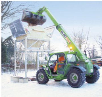
Maschinen von HKL übernehmen Winterdienstaufgaben – von Schneeräumung bis Streugutbestückung.