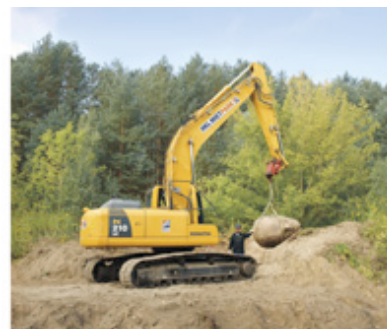
Ein Raupenbagger aus dem HKL MIETPARK legte den Granit-Kopf der Lenin-Statue in etwa fünf Meter Tiefe frei.