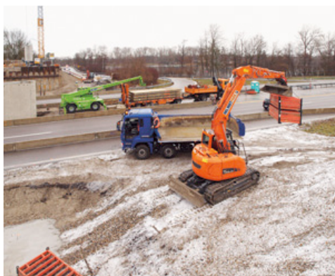
Zahlreiche Maschinen aus dem HKL MIETPARK sind beim Neubau einer A8-Überführung bei München aktiv.