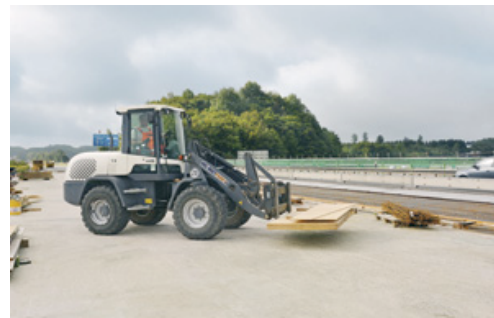
Ein Radlader aus dem HKL MIETPARK übernahm den gesamten Materialtransport bei der Brückensanierung am Kreuz Olpe-Süd.