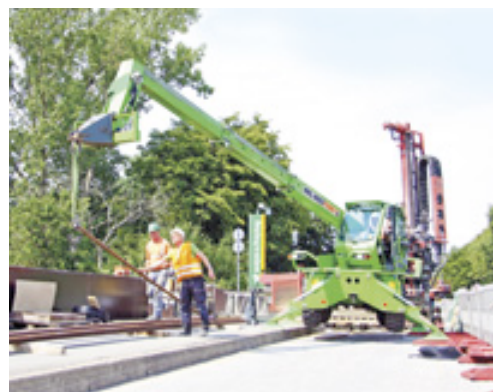
Eine Teleskopmaschine aus dem HKL MIETPARK hilft bei der Herstellung von Verpresspfählen für den Neubau der Possehlbrücke.