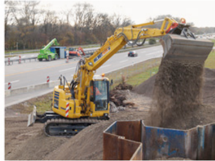
Neue Überführung an der A8: Bagger von HKL bei der Hinterfüllung der Brückenwiderlager.