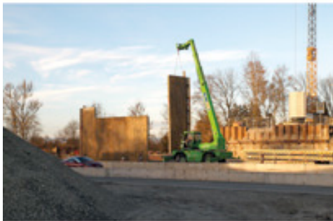
Neuer Brückenpfeiler: Leistungsstarke Teleskopmaschinen von HKL befördern Schalungsteile in die Mitte der Fahrbahn.