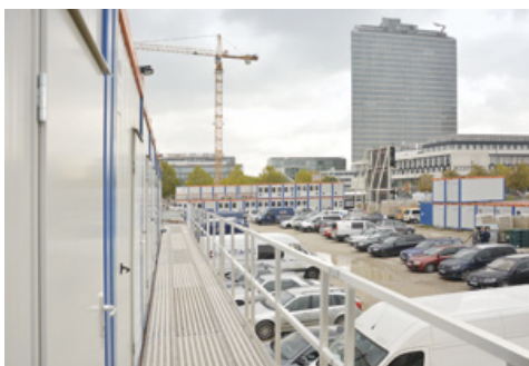
Rund 110 HKL Container sind Baubegleiter in der Münchener Parkstadt-Schwabing.