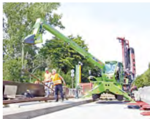
Eine Teleskopmaschine aus dem HKL MIETPARK hilft bei der Herstellung von Verpresspfählen für den Neubau der Possehlbrücke.