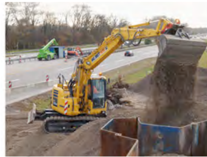
Neue Überführung an der A8: Bagger von HKL bei der Hinterfüllung der Brückenwiderlager.