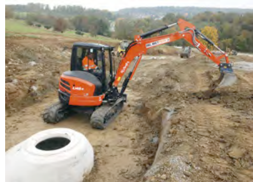
Kompaktbagger von HKL helfen bei der Erschließung des Neubaugebiets „Lau“ in Ölbronn.