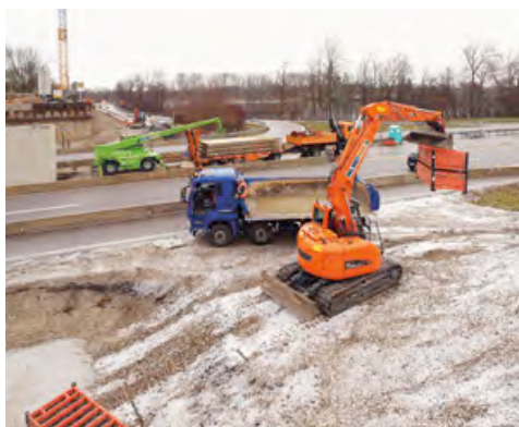
Zahlreiche Maschinen aus dem HKL MIETPARK sind beim Neubau einer A8-Überführung bei München aktiv.