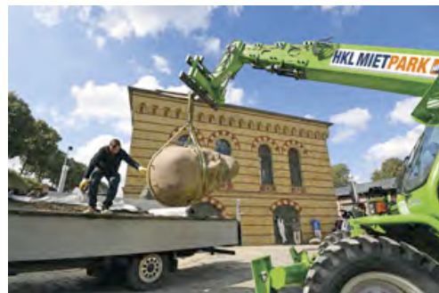
Entladung und Aufstellung des Lenin-Kopfes in der Zitadelle Spandau übernahm eine Teleskopmaschine von HKL.