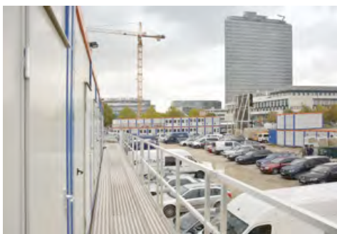
Rund 110 HKL Container sind Baubegleiter in der Münchener Parkstadt-Schwabing.