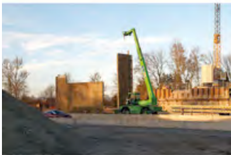
Neuer Brückenpfeiler: Leistungsstarke Teleskopmaschinen von HKL befördern Schalungsteile in die Mitte der Fahrbahn.