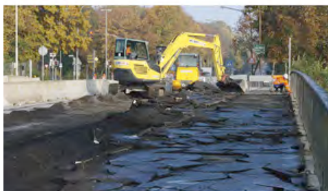
Voller Einsatz über der Trave: Minibagger und Radlader von HKL sind auf der Possehlbrücke in Lübeck aktiv.