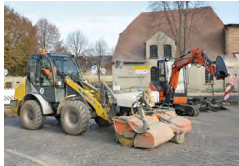
Einsatz an der B176: Ein mit Anbauehrmaschine ausgestatteter Radlader von HKL sorgt für Sauberkeit auf dem Bauabschnitt.