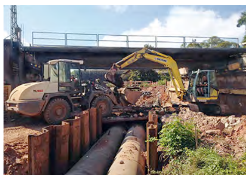
Bagger und Radlader von HKL arbeiten Hand in Hand und sorgen so für Effizienz auf der Baustelle.