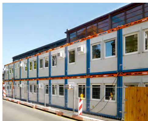
Raumsysteme von HKL begleiten in Berlin den Umbau des historischen Bahnhof Zoo.