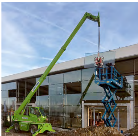
Ein Teleskoplader aus dem HKL MIETPARK mit einer Reichweite von 13 Metern übernimmt die Beförderung der Glasscheiben zu ihrem Bestimmungsort.