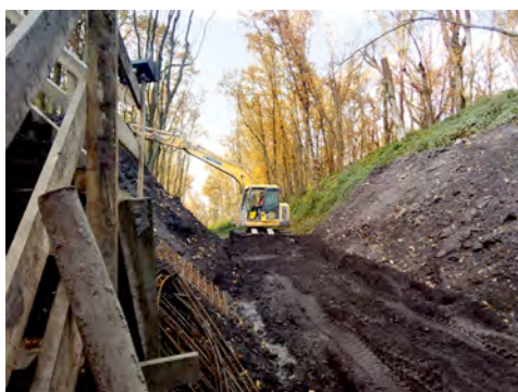
Ein Raupenbagger bei HKL unterstützt beim Ausbau des Springorum-Radwegs in Bochum.