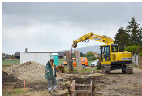
Ein Raupenbagger aus dem HKL MIETPARK hilft bei der Erschließung eines Neubaugebiets in Marchegg.