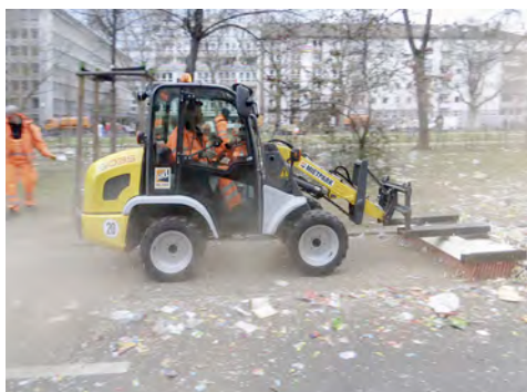
Ein Kramer 5035 Radlader von HKL sorgte für saubere Straßen nach dem Mainzer Fastnachtsumzug (Quelle: Entsorgungsbetrieb der Stadt Mainz).