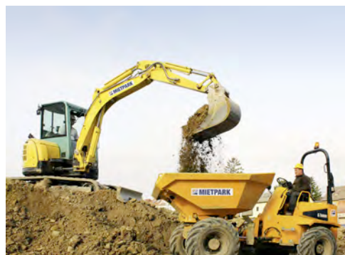
Minibagger und Dumper von HKL unterstützen Supermarkt-Neubau in Wien.