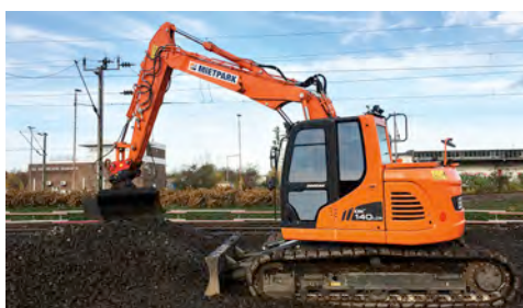
Starker Helfer im Gleisbau: ein leistungsstarker 15-Tonnen-Raupenbagger Doosan DX 140 von HKL.