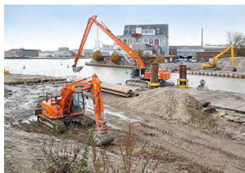
Maschinen von HKL helfen beim Bau der neuen Schillerstraßen-Brücke in Münster.