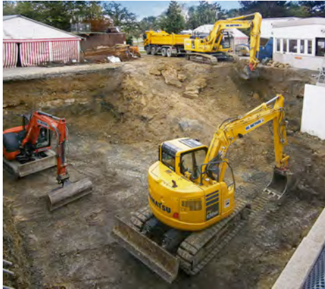
Mehrere Raupenbagger aus dem HKL MIETPARK heben das Fundament für eine Tiefgarage aus.