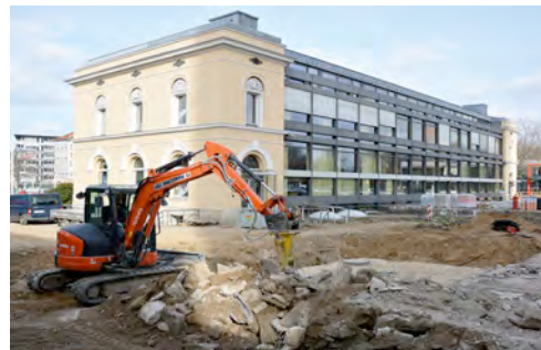
Der Kubota U48 Kompaktbagger aus dem HKL MIETPARK hilft bei Sanierungsarbeiten auf der Braunschweiger Okerinsel.