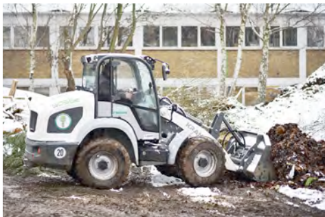
Der vollelektrische Radlader Kramer 5055e überzeugt bei vielseitigen Arbeiten mit einer hohen Nutzlast und seiner langen Laufzeit.