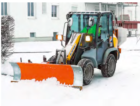
Radlader von HKL sind bei Schneeräumarbeiten unentbehrliche Helfer.