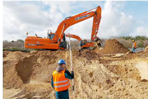
Einsatz in Schwerin: Speziell ausgestattete Doosan DX 225 Raupenbagger von HKL übernehmen Sondierung und Bergung von Kampfmitteln.