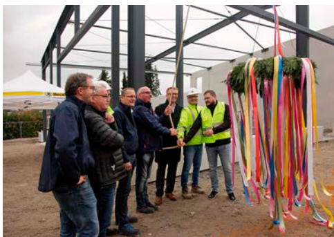
Richtfest HKL Center Hamm: Investor und Nutzer ziehen an einem Strang.