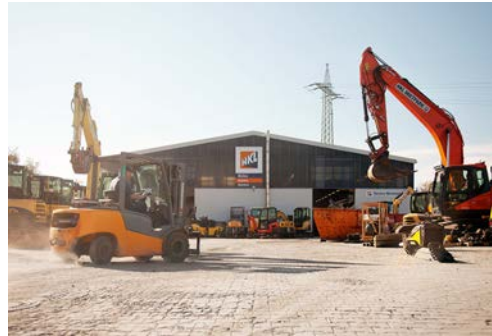
HKL baut sein Centernetz in NRW weiter aus: Im April öffnen die HKL Center in Duisburg und Bocholt.