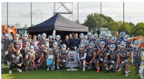
Das HKL Center Bocholt unterstützte das Charity-Football-Turnier mit Trikots und Maschinen.