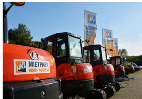
In Rastatt gibt es nun das umfassende Sortiment des HKL MIETPARK und HKL BAUSHOP.