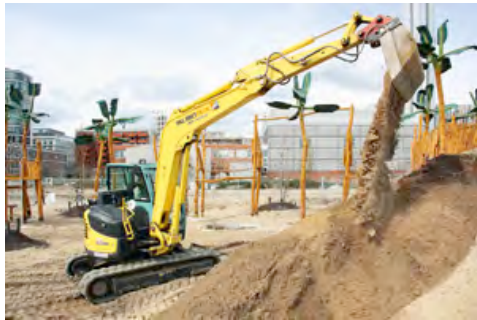
Planungsarbeiten und das Modellieren von Hügeln sind für die leistungsstarken Kompaktbagger aus dem HKL MIETPARK kein Problem.