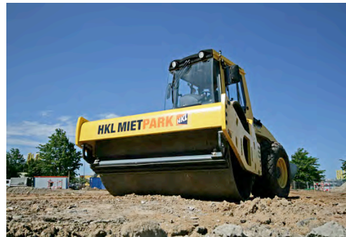
Walze aus dem HKL MIETPARK bei Verdichtungsarbeiten.