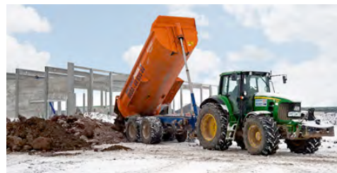
Traktor mit Anhängemulde aus dem HKL MIETPARK beim Abladen von Material.