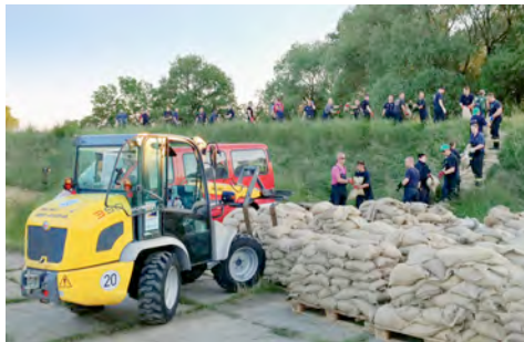
Radlader aus dem HKL MIETPARK stapelten Paletten mit Sandsäcken im Bereitstellungsraum für die Personenketten.