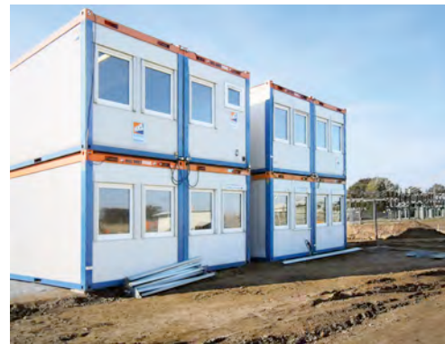
HKL Container dienen dem Baupersonal bei der Errichtung der Power-to-Gas-Anlage von E.ON in Falkenhagen als Einsatzbüro und Aufenthaltsraum.