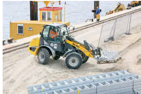
Radlader von HKL als Materialbeförderer – hier beim Transport von Geländer-Bügeln.