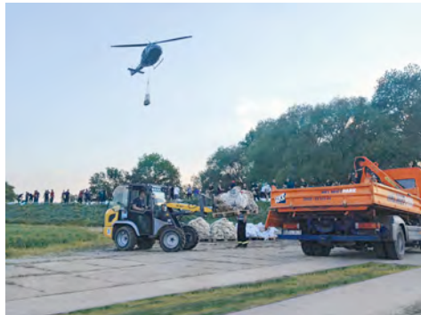
LKW-Kipper und Radlader aus dem HKL MIETPARK waren unermüdlich an den Deichanlagen im Einsatz.