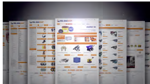
Der neue HKL Onlineshop liegt in puncto Technik, Usability und Inhalt im Branchenvergleich vorn und setzt neue Maßstäbe