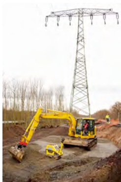
Kettenbagger und Rüttelplatte aus dem HKL MIETPARK unterstützen Fundamentarbeiten im Freileitungsbau zwischen Espenhain und Rötha.