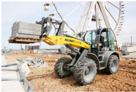
Wendige Radlader aus dem HKL MIETPARK transportieren Erdaushub und Materialien an jeden Winkel des Parks.