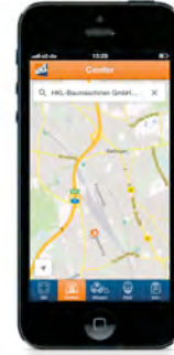
Über das Feature Center finden Nutzer auch mobil direkt zum nächstgelegenen HKL Center und können es direkt aus der App kontaktieren.