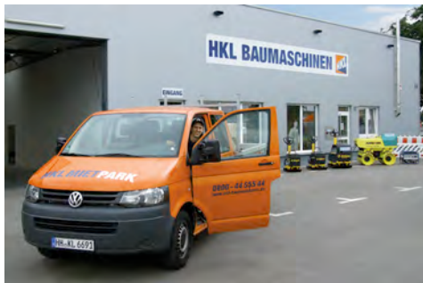
Das moderne neue HKL Center Heilbronn startete am 1. Juli seinen Betrieb.