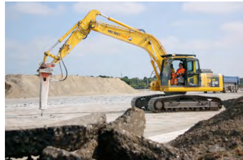
Mit Stemmhammer bearbeitet der Raupenbagger aus dem HKL MIETPARK die enorme Fläche von 14.000 Quadratmetern Landebahn am Hamburger Flughafen.