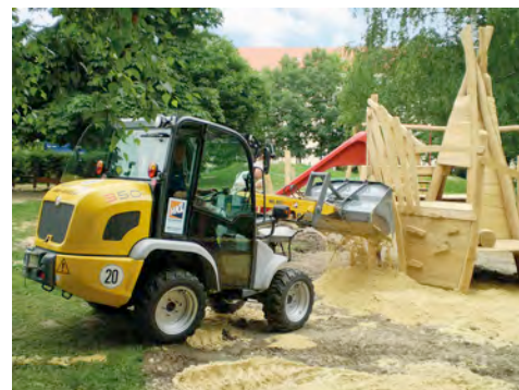
Ein Radlader aus dem HKL MIETPARK verteilt 60 Tonnen Sand auf dem neuen Spielplatz.