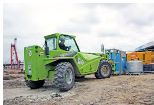
Teleskopmaschinen von HKL helfen beim Installieren der Brückenlaternen.