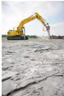
HKL-Mietmaschine mit speziell ausgestatteten Stemmhammer im hohen Einsatz am Hamburger Flughafen.