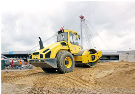
Walze aus dem HKL MIETPARK im vollen Einsatz beim Brückenbauprojekt Hafencity.