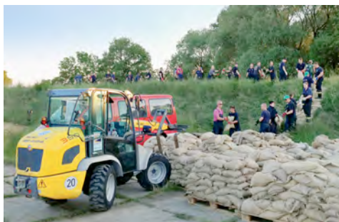
Radlader aus dem HKL MIETPARK stapelten Paletten mit Sandsäcken im Bereitstellungsraum für die Personenketten.