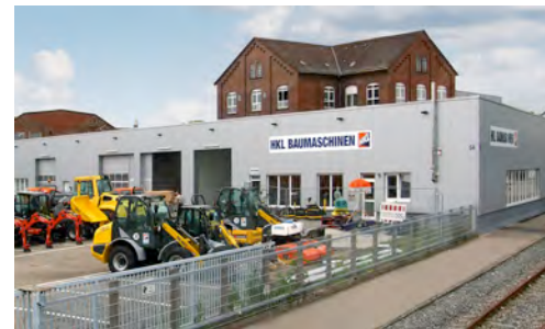
Das modern gestaltete Center in Heilbronn bietet das gesamte Sortiment des HKL MIETPARKs an.