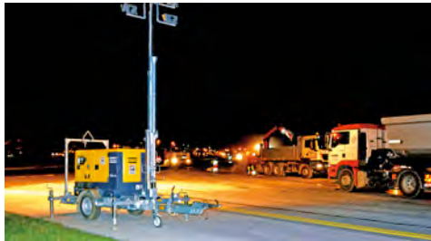
Leistungsstarke Lichtgiraffen aus dem HKL MIETPARK waren unermüdlich im Einsatz.