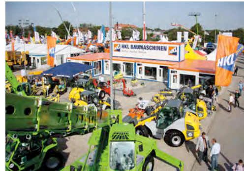
Mit zwei Ständen zeigt HKL BAUMASCHINEN wirtschaftliche Stärke auf der NordBau 2013.