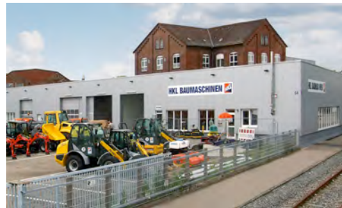
Das modern gestaltete Center in Heilbronn bietet das gesamte Sortiment des HKL MIETPARKs an.