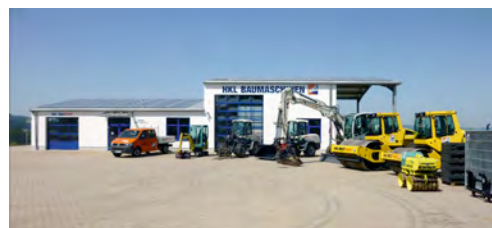
Neues HKL Center in Bayreuth eröffnet