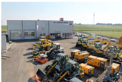
Der HKL BAUSHOP bietet eine große Auswahl an Baugeräten zum Kauf.