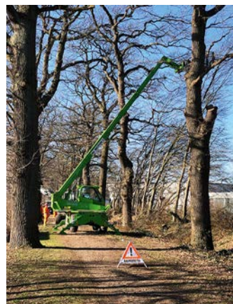
Das HKL Center Lübeck hat kurzfristig einen Teleskopplader für Baumschnittarbeiten zur Verfügung gestellt.