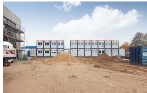
HKL begleitet den Bau des neuen Großmarkts für die Handelshof-Gruppe in Rostock.