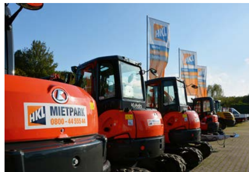
In Rastatt gibt es nun das umfassende Sortiment des HKL MIETPARK und HKL BAUSHOP.