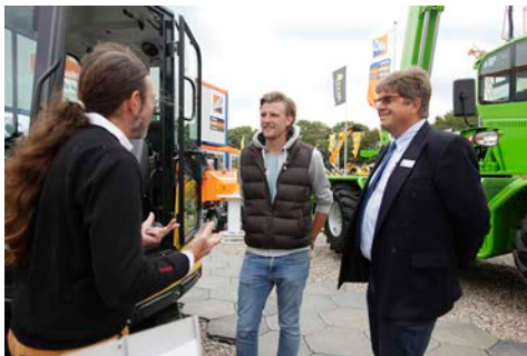
Die Fachmesse nutzt HKL für den direkten Erfahrungsaustausch mit Kunden und Herstellern.