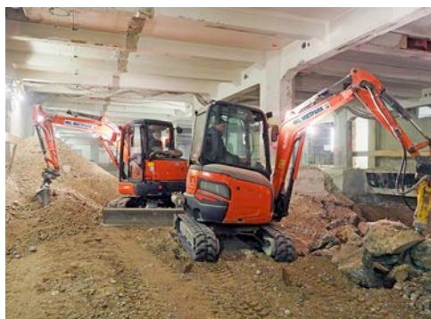
Für die Erdarbeiten im Kellerbereich des Deutschen Museums stellte HKL kompakte Maschinen mit Rußpartikelfiltern zur Verfügung.