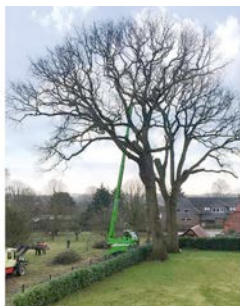
Ein Merlo Roto Teleskopstapler von HKL half bei Baumfällarbeiten in Schleswig-Holstein.