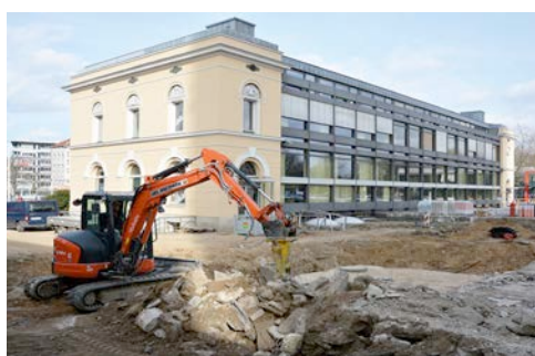
Der Kubota U48 Kompaktbagger aus dem HKL MIETPARK hilft bei Sanierungsarbeiten auf der Braunschweiger Okerinsel.