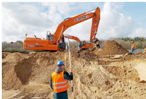
Einsatz in Schwerin: Speziell ausgestattete Doosan DX 225 Raupenbagger von HKL übernehmen Sondierung und Bergung von Kampfmitteln.