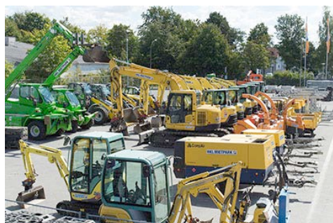
Kurze Wege, breites Maschinenangebot und passgenauer Service - HKL eröffnet neues Center in Aachen.