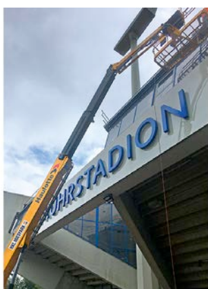
Bei der Stadionsanierung in Bochum überzeugte die Teleskopbühne aus dem HKL MIETPARK mit hoher Reichweite und festem Stand.