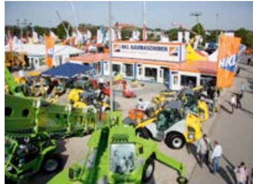
Mit zwei Ständen zeigt HKL BAUMASCHINEN wirtschaftliche Stärke auf der NordBau 2014.