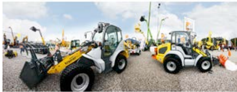
HKL BAUMASCHINEN präsentiert zahlreiche Produkt-Innovationen auf der NordBau 2014.