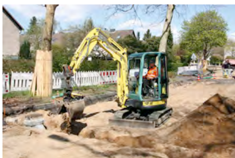
Alte Landstraße Hamburg: Minibagger aus dem HKL MIETPARK heben tiefe Gruben für Drosselwerke, Filterschächte und Rohrelemente aus.