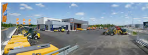
Das neue HKL Center Neuss überzeugt durch Modernität, gute Erreichbarkeit und Service auf höchstem Niveau.