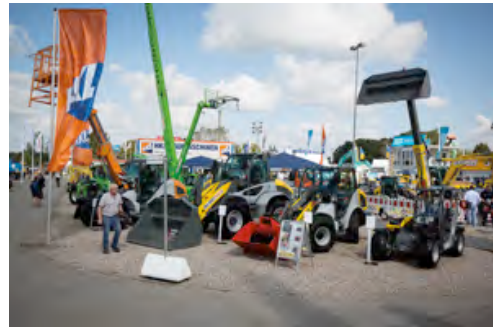
Auf der NordBau 2015 zeigt HKL einen Querschnitt seiner Baumaschinen, Baugeräte, Raumsysteme, Kommunaltechnik und Fahrzeuge.