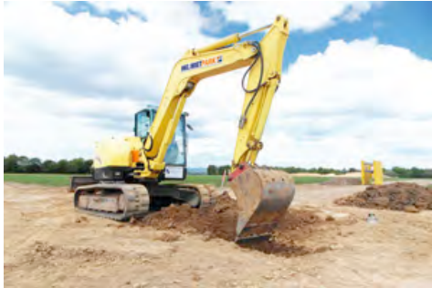
Ein Kompaktbagger von HKL unterstützt die Kampfmittelbergung auf dem Gelände eines neuen Gewerbegebietes in Nordhessen.