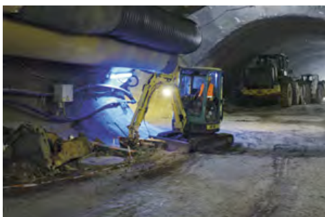
Ein Minibagger aus dem HKL MIETPARK beim Bauprojekt Rosensteintunnel in Stuttgart.