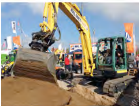
Der Branchenführer HKL präsentiert Qualitätsmarken wie Yanmar, Kramer, Kubota, Merlo und Ammann.