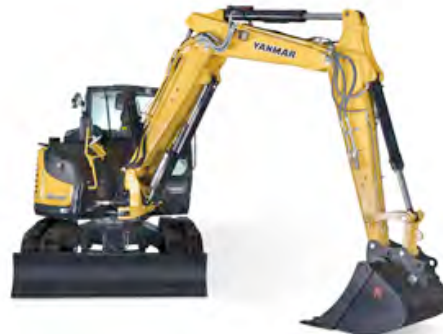
Der SV100-2 mit hydraulischem Verstellausleger wird auf der NordBau erstmalig öffentlich vorgestellt – exklusiv durch HKL.