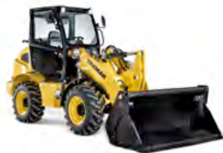
Das Modell V8 der neuen Yanmar-Radlader-Serie kommt Ende 2015 auf den Markt.