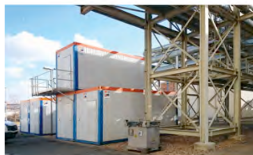
HKL Containeranlage am Standort Staßfurt.