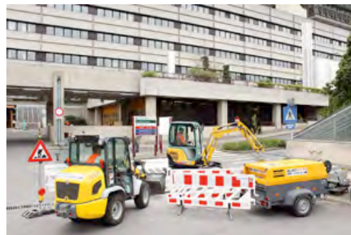
Bagger, Radlader und Kompressoren aus dem HKL MIETPARK übernehmen die Sanierung der Entwässerungsrinnen am AKH Wien.