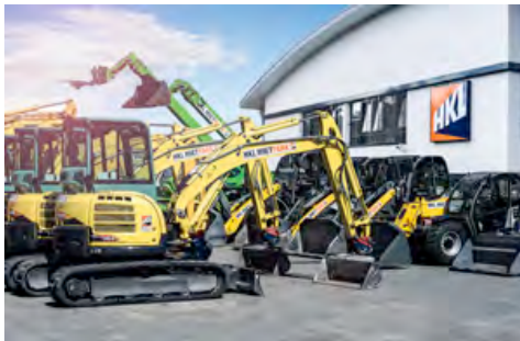
In den gut ausgestatteten HKL Centern finden Baufirmen zuverlässige Baumaschinen in beliebiger Stückzahl.