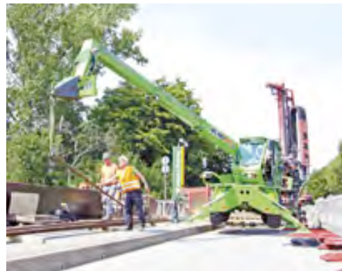
Eine Teleskopmaschine aus dem HKL MIETPARK hilft bei der Herstellung von Verpresspfählen für den Neubau der Possehlbrücke.