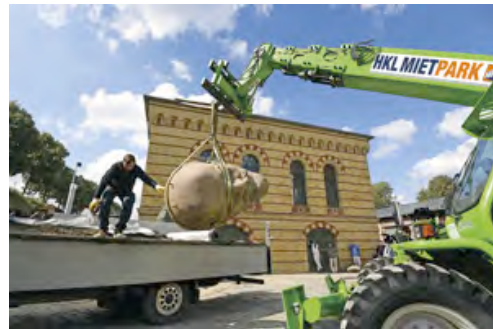
Entladung und Aufstellung des Lenin-Kopfes in der Zitadelle Spandau übernahm eine Teleskopmaschine von HKL.