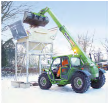
Maschinen von HKL übernehmen Winterdienstaufgaben – von Schneeräumung bis Streugutbestückung.