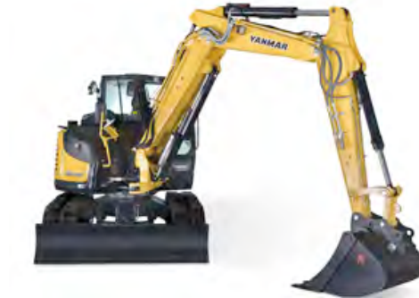
Der SV100-2 mit hydraulischem Verstellausleger wird auf der NordBau erstmalig öffentlich vorgestellt – exklusiv durch HKL.