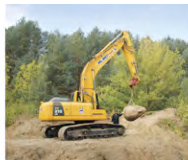
Ein Raupenbagger aus dem HKL MIETPARK legte den Granit-Kopf der Lenin-Statue in etwa fünf Meter Tiefe frei.