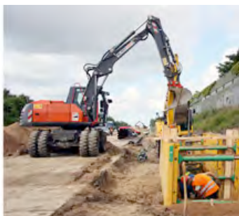
Unermüdlicher Einsatz an der A1: Maschinen von HKL bei Erdbewegungsarbeiten.