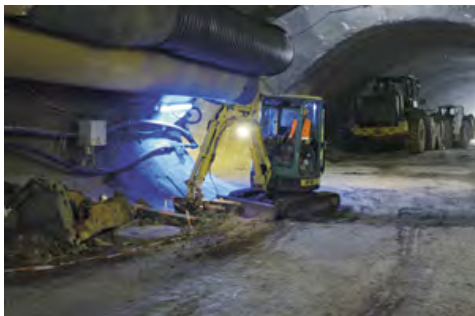
Ein Minibagger aus dem HKL MIETPARK beim Bauprojekt Rosensteintunnel in Stuttgart.