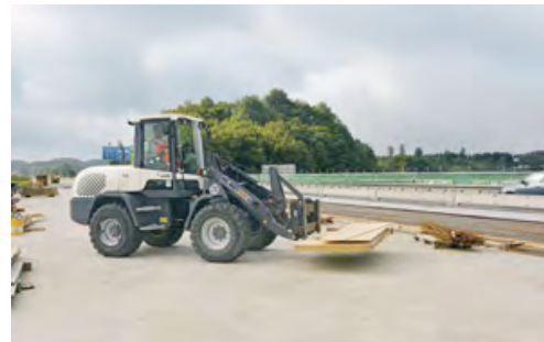
Ein Radlader aus dem HKL MIETPARK übernahm den gesamten Materialtransport bei der Brückensanierung am Kreuz Olpe-Süd.