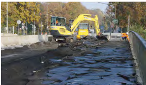
Voller Einsatz über der Trave: Minibagger und Radlader von HKL sind auf der Possehlbrücke in Lübeck aktiv.