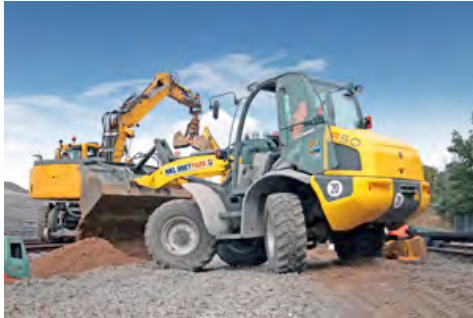
Ein allradgelenkter Radlader von HKL übernahm Transport und Umladung von Erdmassen und Schotter.