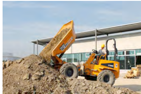
Permanent im Einsatz: Ein wendiger Drehkip-Dumper aus dem HKL MIETPARK transportiert den anfallenden Aushub am neuen EKZ Wiener Neudorf.