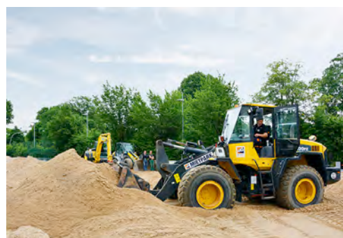
Nach dem Turnier verlud ein 12-Tonnen Radlader den Sand zum Abtransport auf die Sattelschlepper.