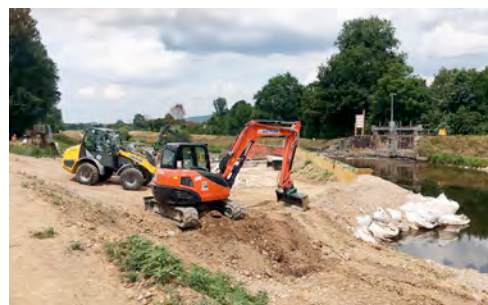
Ein gutes Team: Radlader und Kompaktbagger aus dem HKL MIETPARK helfen bei der Sanierung des Kollmarsreuter Wehrs.