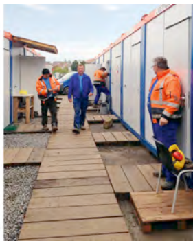
Raumsysteme von HKL begleiten den Bau von zwei Trinkwasserleitungen im Bereich des Erschließungsprojektes NeckarPark.