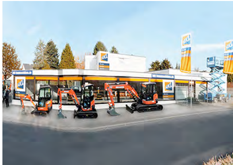
HKL eröffnet neues Center in Bergisch Gladbach.