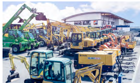
HKL eröffnet neues Center in Wolfsburg.