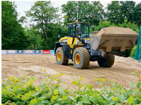
Dank 2,1 Kubikmeter Schaufelinhalt kann der Radlader die 2.000 Tonnen Sand zügig verladen.