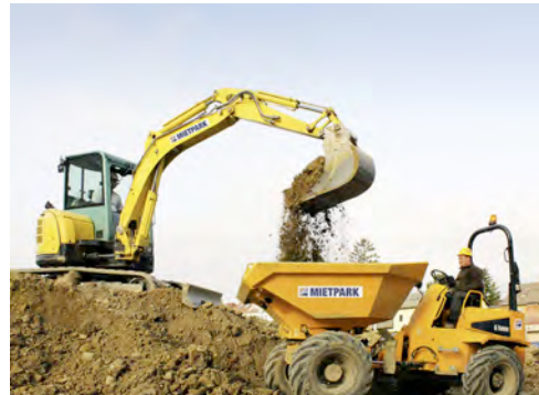
Minibagger und Dumper von HKL unterstützen Supermarkt-Neubau in Wien.