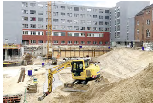
Maschinen aus dem HKL MIETPARK sind beim Aus- und Umbau des Universitätsklinikum Schleswig-Holstein (UKSH) auf dem Kieler Campus aktiv.