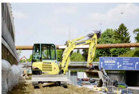
Ausbau A7: Ein Minibagger von HKL hilft beim Aufbau eines etwa vier Meter hohen Podestes am Fahrbahnrand.