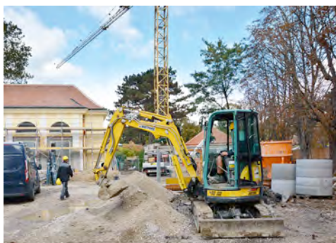
Maschinen aus dem HKL MIETPARK sind beim Umbau des Giraffengeheges im Tiergarten Schönbrunn aktiv.