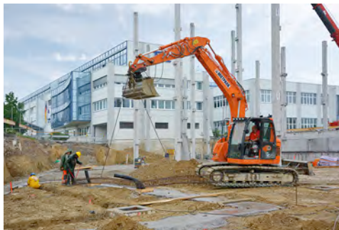
Ein Raupenbagger von HKL ist beim Bau des neuen Technologiezentrums für Physik Instrumente (PI) im Einsatz.