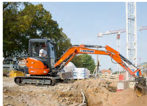
Ein Kompaktbagger von HKL übernimmt Aushubarbeiten beim Bau neuer Mietwohnungen in Dresden.