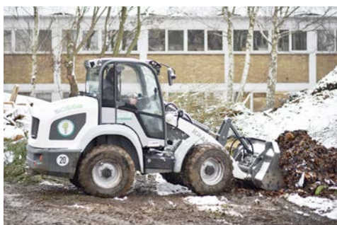
Der vollelektrische Radlader Kramer 5055e überzeugt bei vielseitigen Arbeiten mit einer hohen Nutzlast und seiner langen Laufzeit.