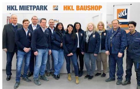
HKL Experten beraten während der MAWEV-Show 2018 rund um die Themen Miete, Kauf, Einsatzgebiete und Wirtschaftlichkeit von Baumaschinen.