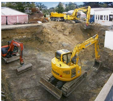
Mehrere Raupenbagger aus dem HKL MIETPARK heben das Fundament für eine Tiefgarage aus.