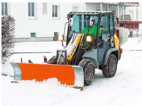
Radlader von HKL sind bei Schneeräumarbeiten unentbehrliche Helfer.