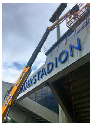
Bei der Stadionsanierung in Bochum überzeugte die Teleskopbühne aus dem HKL MIETPARK mit hoher Reichweite und festem Stand.