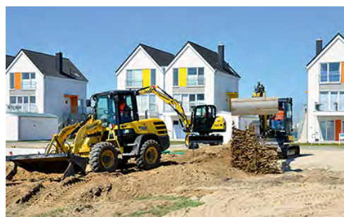
Treuer HKL Kunde: Firma Paasch erweiterte seinen Maschinenpark kürzlich mit dem Schwenklader V70S, dem neuen Kurzheck-Midibagger SV60 und dem kompakten Mobilbagger B75W aus dem Hause Yanmar.