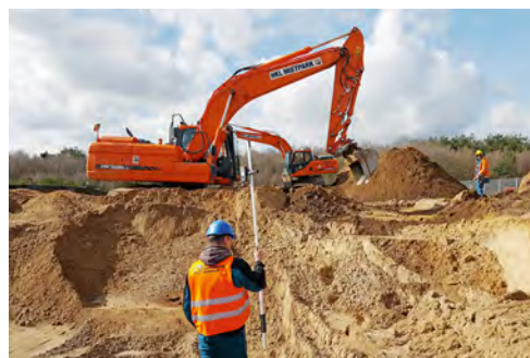
Einsatz in Schwerin: Speziell ausgestattete Doosan DX 225 Raupenbagger von HKL übernehmen Sondierung und Bergung von Kampfmitteln.