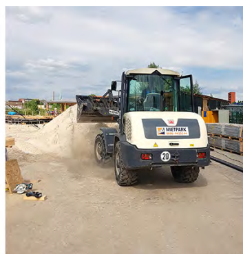
Ein Radlader aus dem HKL MIETPARK übernahm das Verteilen von 400 Tonnen Sand für den Party-Strand, der bis zu 2.000 Leute fasst.