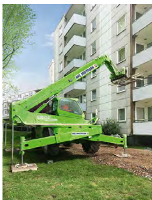
Der Merlo Roto 45.21 Teleskopstapler aus dem HKL MIETPARK stützte die Bodenplatten der Balkone und transportierte sie direkt am Haus entlang ab.