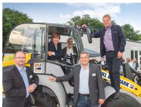
HKL präsentiert auf Berliner-Branchentreff den vollelektrisch betriebenen Radlader Kramer 5055e.