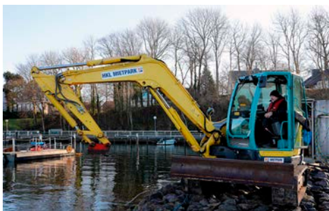
HKL Mietmaschine aus dem HKL Center Kiel im Einsatz am Hafen in der Kieler Förde.