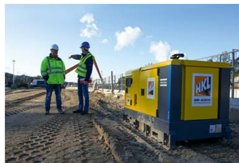
Zusätzlich sichern Stromaggregate von HKL jederzeit eine ausreichende Stromversorgung.