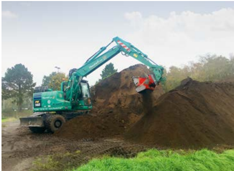
Die Allu Siebschaufel aus dem HKL MIETPARK im Einsatz am Hamburg Airport.