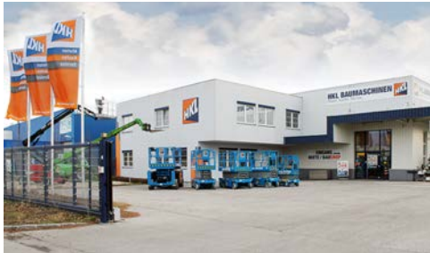
Das HKL Arbeitsbühnen- und Teleskopcenter (ATC) in Wiener Neudorf bietet Höhentechnik für ganz Österreich.