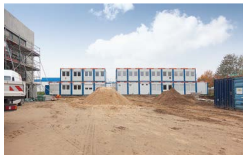
HKL begleitet den Bau des neuen Großmarkts für die Handelshof-Gruppe in Rostock.