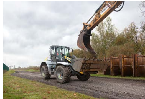
Mit dem Kramer 8155 führt HKL eine neue Größenklasse aus dem Kramer Radlader-Produktportfolio.