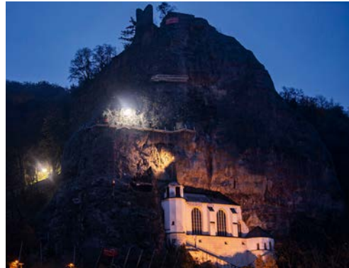
Moderne HKL Lichttechnik unterstützt die Felsensicherung an der Felsenkirche in Idar-Oberstein.