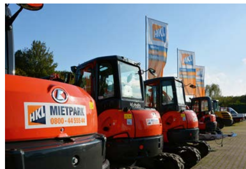
In Rastatt gibt es nun das umfassende Sortiment des HKL MIETPARK und HKL BAUSHOP.