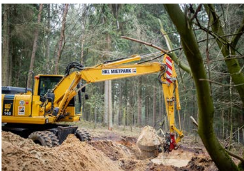
Baumaschinen aus dem HKL MIETPARK im Einsatz am Wildpark Lüneburger Heide.