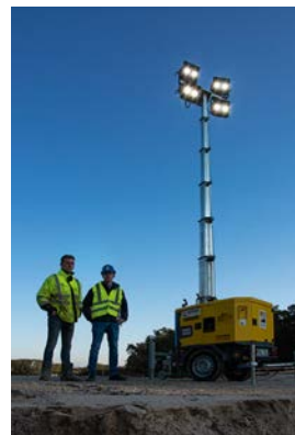
Insgesamt drei LED Lichtmaste HiLight H5+ aus dem HKL MIETPARK sorgen für ausreichend Helligkeit.