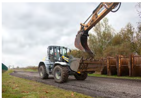
Mit dem Kramer 8155 führt HKL eine neue Größenklasse aus dem Kramer Radlader-Produktportfolio.