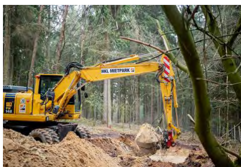
Baumaschinen aus dem HKL MIETPARK im Einsatz am Wildpark Lüneburger Heide.