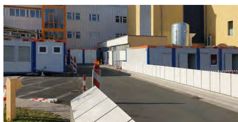
Zehn HKL Raumsysteme entlasten die Eingangssituation der Notaufnahme des Klinikums Fürth.