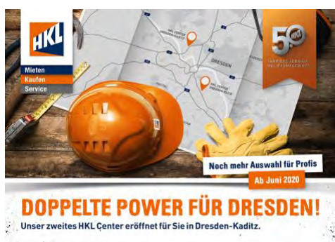
Anfang Juni eröffnete HKL sein zweites Center in Dresden – Kötzschenbroderstraße 140.