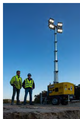
Insgesamt drei LED Lichtmaste HiLight H5+ aus dem HKL MIETPARK sorgen für ausreichend Helligkeit.