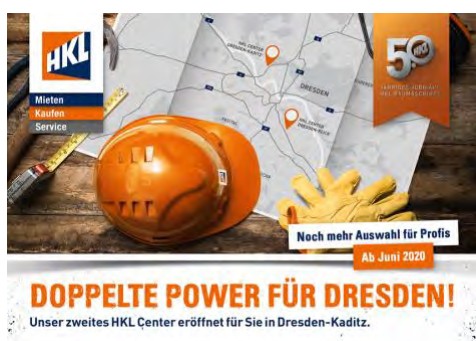
Anfang Juni eröffnete HKL sein zweites Center in Dresden – Kötzschenbroderstraße 140.