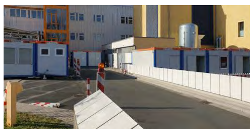
Zehn HKL Raumsysteme entlasten die Eingangssituation der Notaufnahme des Klinikums Fürth.