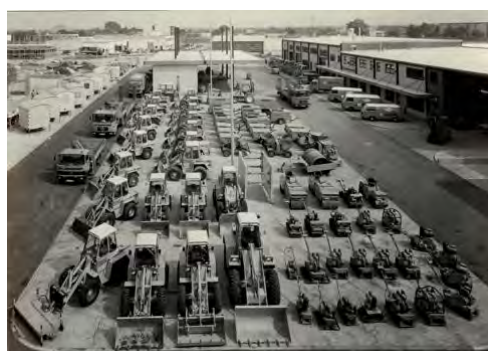
Schon 1980 verfügte HKL über einen großen Mietpark an kompakten Baumaschinen und Geräten.