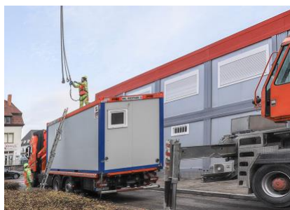
Für eine temporäre Unterkunft in Ettlingen liefert HKL schnell und unkompliziert die passenden Sanitärcontainer an.