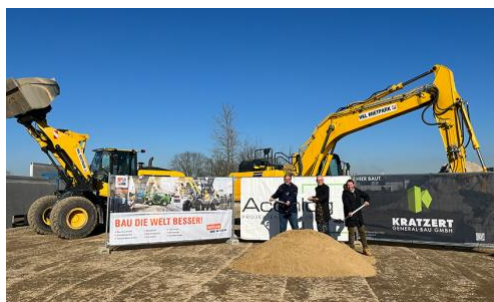
Gute Bedingungen für den Spatenstich zum Neubau des HKL Center Krefeld: Sonnenschein und milde Temperaturen sorgten für ein gelungenes Event.