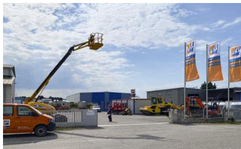
Mit dem neuen Center in St. Pölten stärkt HKL BAUMASCHINEN AUSTRIA seine Präsenz in der Landeshauptstadt von Niederösterreich.