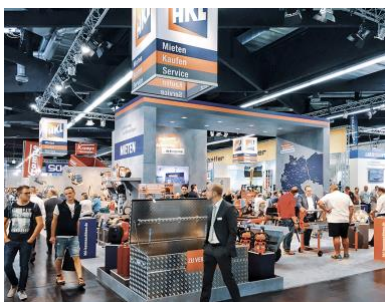
Der persönliche Austausch, Fachberatung und Branchentrends stehen im Mittelpunkt der Messeauftritte von HKL auf den Leitmesssen GaLaBau und bauma 2022.