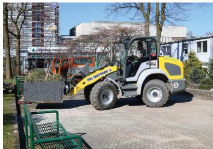
Der vollelektrische Kramer 5055e Radlader aus dem HKL MIETPARK hilft bei der Neugestaltung des Eingangsbereiches der Asklepios Klinik Wandsbek in Hamburg.